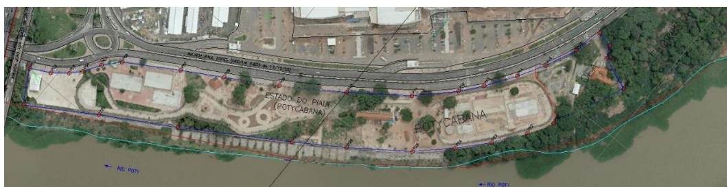
Figura 1– Macrolocalização do Parque Estadual Potycabana.

Este documento visa fornecer, aos interessados na Concorrência Pública, as especificações de natureza meramente referencial com intuito de demonstrar a viabilidade do projeto Potycabana e, portanto, não cria obrigação ou direito para o parceiro privado ou para a administração pública. Nesse sentido, cabe ao parceiro privado, elaboração e apresentação de sua proposta, realizar estudos próprios, obedecendo às condições e regras previstas no EDITAL e de seus ANEXOS.