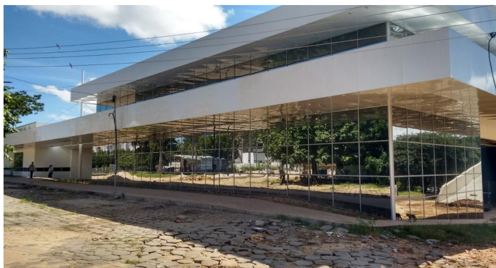
Figura 3 Centro de Convenções - Entrada Principal - 18/04/2018