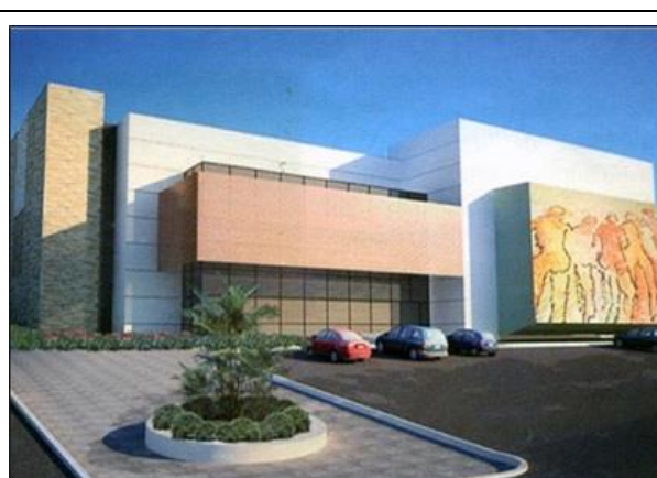
Figura 02: Modelo da fachada do Centro de Convenções.