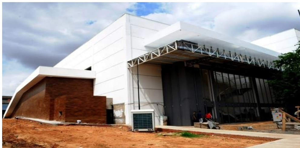
Figura 4 Centro de Convenções - Área de Urbanização - 09/01/2018