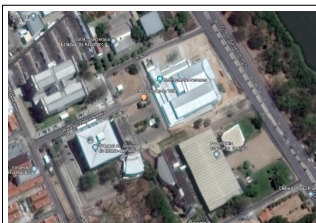
Figura 01: Vista aérea do Centro de Convenções de Teresina.

A história recente sobre o equipamento infere-se que, no ano de 2016, após vencer disputas jurídicas existentes, a Secretaria de Turismo do Estado do Piauí retomou as obras voltadas para reforma do Centro de Convenções de Teresina. Todavia, durante o período de retomada dos serviços, o governo estadual enfrentou diversas situações de dificuldade financeira, algumas, inclusive, afetadas pela decisão do governo federal, que impediram a execução regular do cronograma de obra e resultaram no atraso da entrega do equipamento.