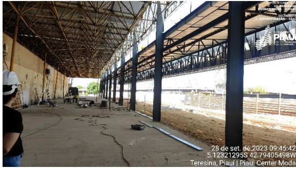
Figura 9 – Obras do espaço para os restaurantes