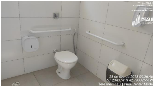
Figura 29 – Banheiro com acessibilidade.