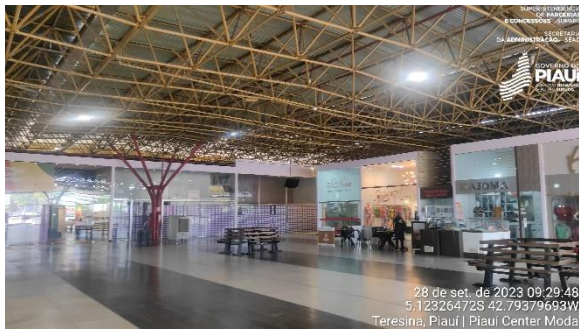
Figura 13 - Área interna