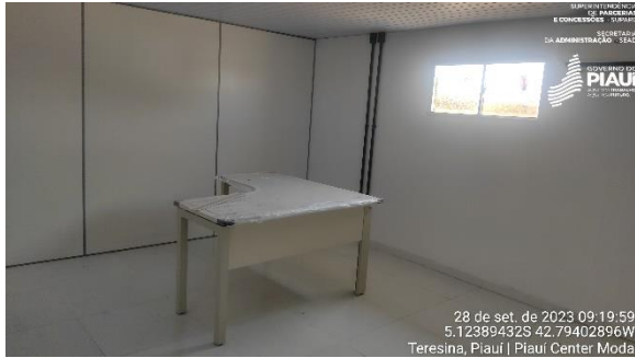
Figura 25 – Espaço destinado ao Espaço Cidadania.