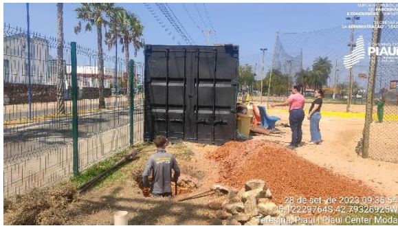
Figura 17 – Obras de revitalização do contêiner.