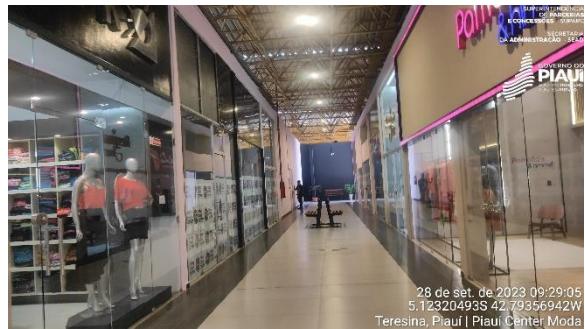
Figura 14 - Área interna - Corredores