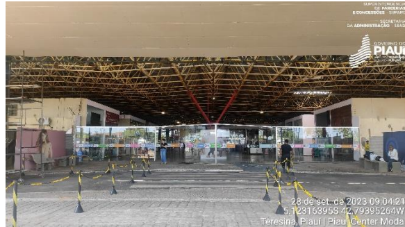
Figura 2 – Estacionamento.