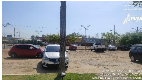
Figura 4 – Estacionamento.