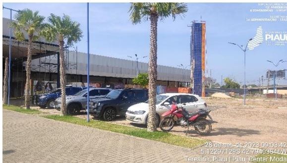
Figura 3 – Estacionamento.