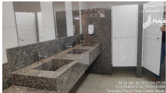
Figura 30 – Pias e boxes dos banheiros.