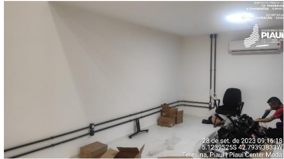
Figura 26 – Espaço destinado ao Espaço Cidadania.