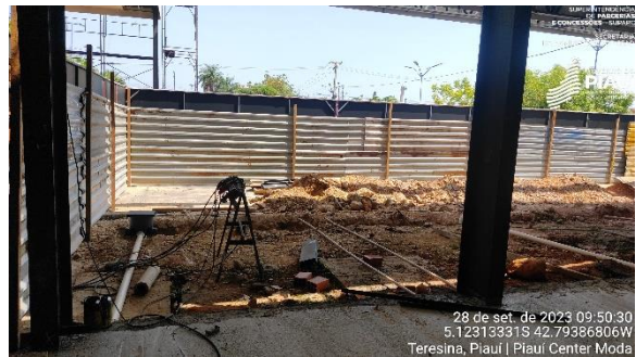
Figura 12 – Instalações hidráulicas em andamento.