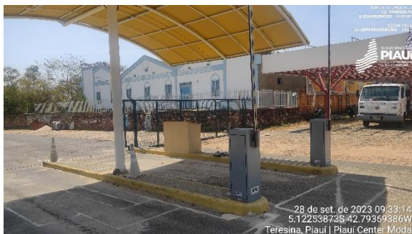
Figura 5 - Cancela de entrada e saída de veículos.