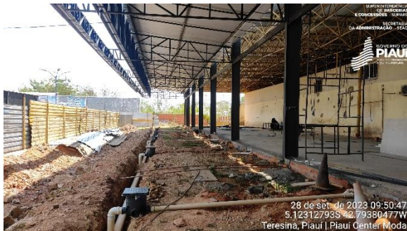
Figura 11 – Instalações hidráulicas em andamento.