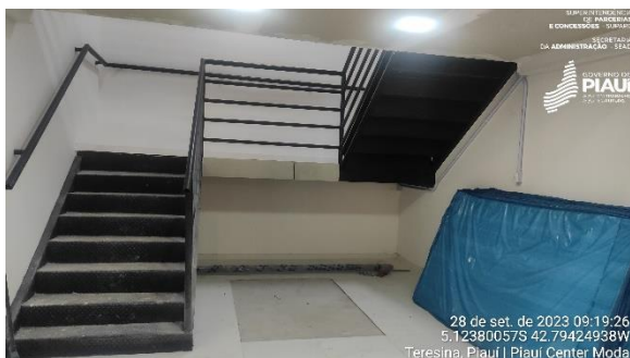
Figura 23 – Espaço destinado ao Espaço Cidadania.