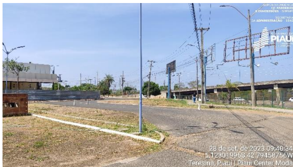
Figura 19 – Entrada secundária.