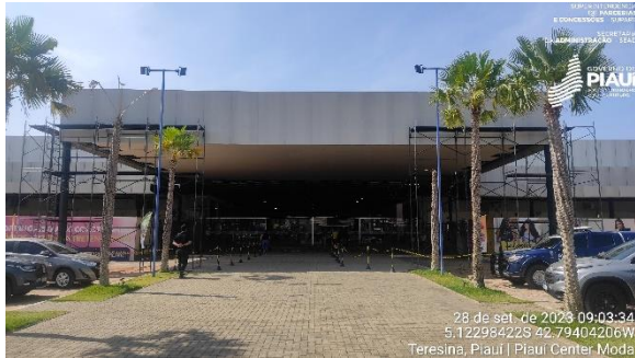
Figura 1 - Entrada principal e estacionamento.