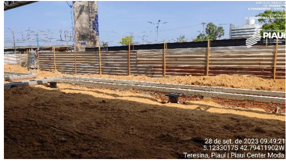
Figura 10 – Instalações hidráulicas em andamento.