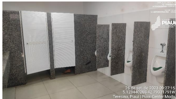
Figura 28 – Banheiros.