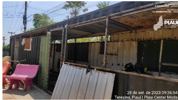
Figura 18 – Obras de revitalização do contêiner.