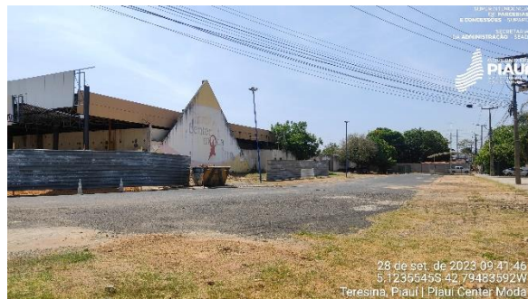
Figura 20 – Entrada secundária.