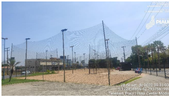
Figura 15 – Quadra de areia.