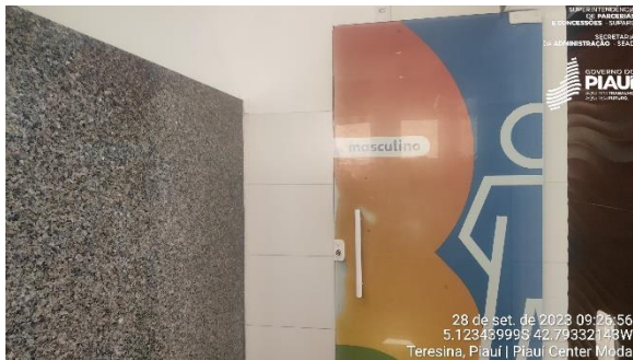
Figura 27 – Banheiros.