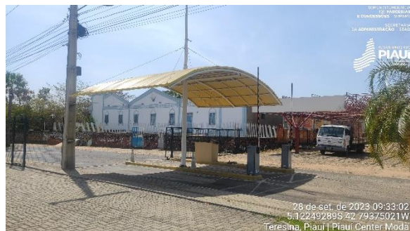
Figura 6 - Cancela de entrada e saída de veículos.