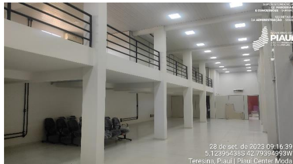
Figura 22 – Espaço destinado ao Espaço Cidadania.