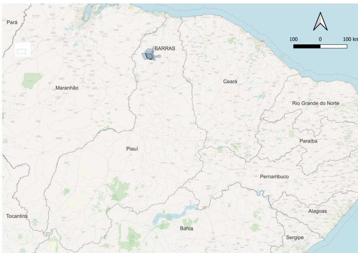
Figura 1: Localização do projeto de Miniusina, Barras - PI

A presente seção apresenta o diagnóstico socioeconômico do município beneficiado pelo projeto de Miniusina. O projeto prevê a construção, operação, manutenção e gestão de miniusina de geração de energia solar fotovoltaica, com gestão e operação de serviços de compensação de créditos de energia elétrica por meio de Geração Distribuída (GD). O município beneficiado diretamente com os projetos será Barras (Figura 1).