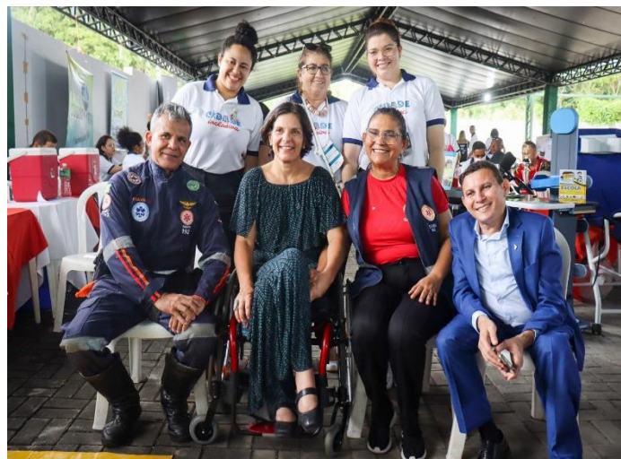
Figura 5 – Ação Cidade Inclusiva

Nos dias 9 e 10 de março, deste ano, a SPE Piauí conectado participou da segunda edição da ação “Cidade Inclusiva” promovida pelo Governo do Estado do Piauí através da SEID - Secretaria de Estado para Inclusão da Pessoa com Deficiência, fornecendo internet para a viabilização de diversos serviços oferecidos às pessoas com deficiência como emissão de documentos, orientações jurídicas, oficinas e palestras.