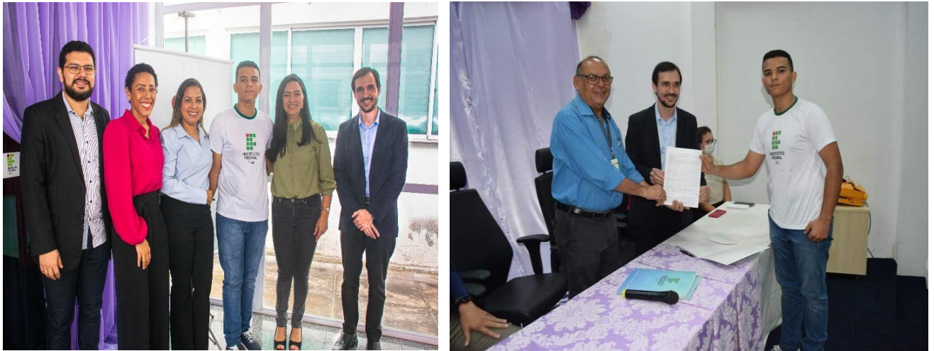
Figura 4 – Solenidade de contratação de jovem aprendiz